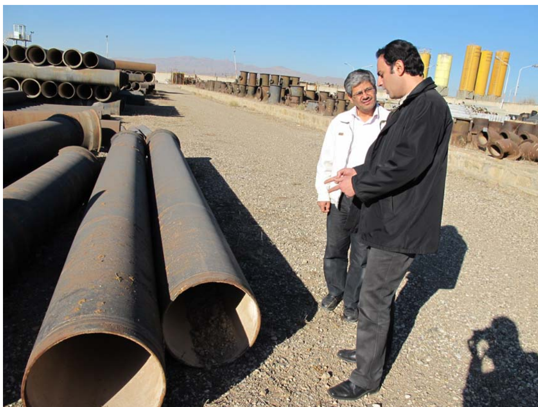
تصویر ۴- لوله‌های چدنی نشکن با قدمت بیش از ۳۶ سال همچنان آماده مصرف