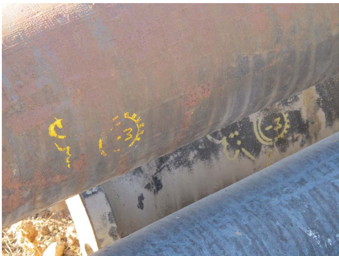
تصویر ۸-لوله‌های گلندی چدنی خاکستری تولید لوله و ماشین‌سازی ایران با قدمت ۳۷ سال در معرض عوامل جوی