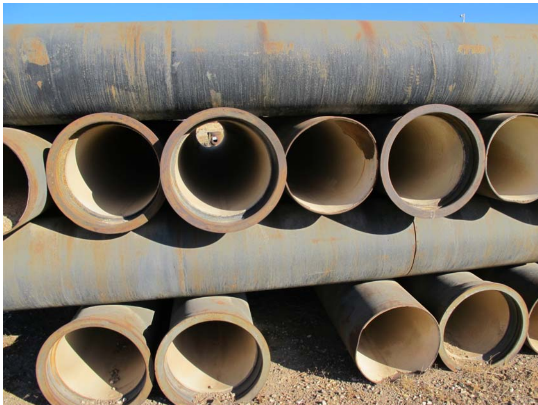
تصویر ۳- دپوی لوله‌های چدنی نشکن با قدمت بیش از ۳۶ سال

تعدادی از این لوله‌ها نیز از سال ۱۳۵۳ در انبار شهر صنعتی دپو شده‌اند که بدون تغییر محسوسی در کیفیت آن، همچنان آماده استفاده می‌باشند (تصاویر ۳ الی ۵).